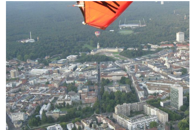
(Über Karlsruhe Richtung Schloss)

Sitzplätze: 2 Höchstgeschwindigkeit: 145 km/h Reisefluggeschwindigkeit: 100 km/h Motorleistung: 100 PS Reichweite: 400 km